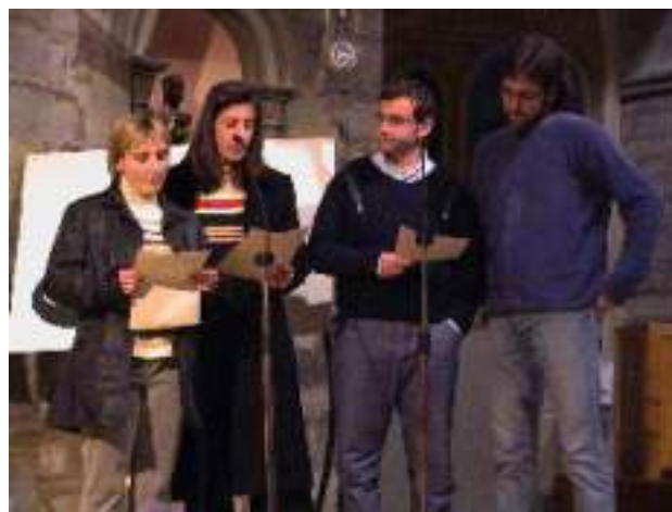
Alguns membres del Grup de teatre llegint uns versos