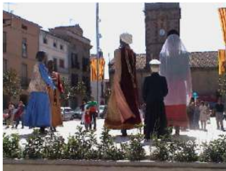
Els gegants d'Avinyó durant l'actuació de la festa major