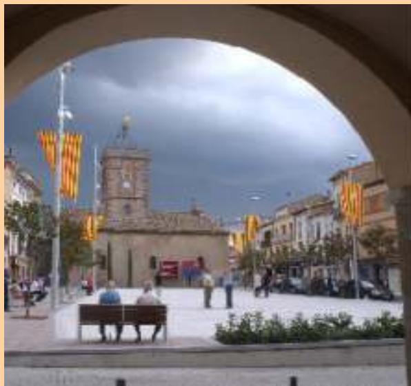
Passat i present de la plaça Major