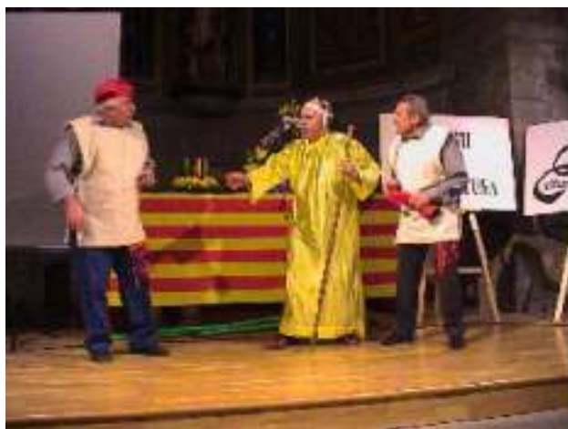
Representant un fragment dels Pastorets