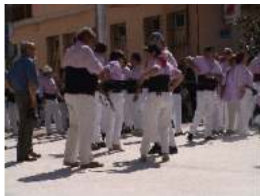
Preparant-se per fer castells

Del 13 al 17 de setembre es va celebrar una nova edició de la Festa Major d'Avinyó. Els actes més tradicionals com el concurs de dibuix i pintura i els gegants es van compaginar amb els balls a l'envelat i les sardanes a la plaça. Com a acte estrella, enguany, el diumenge al migdia, hi va haver l'actuació casteller dels Minyons de Terrassa, a la nova plaça Major. Els egarencs van carregar i descarregar un 2 de 7, un 3 de 8, un 4 de 8 i el difícil pilar de 6, que va tancar l'actuació. Tampoc va faltar a la festa el tradicional castell de focs d'artifici.