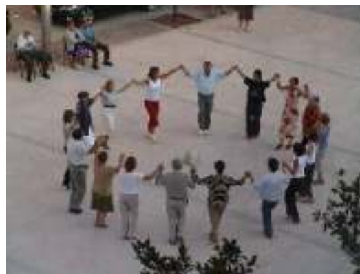
Sardanes a la plaça