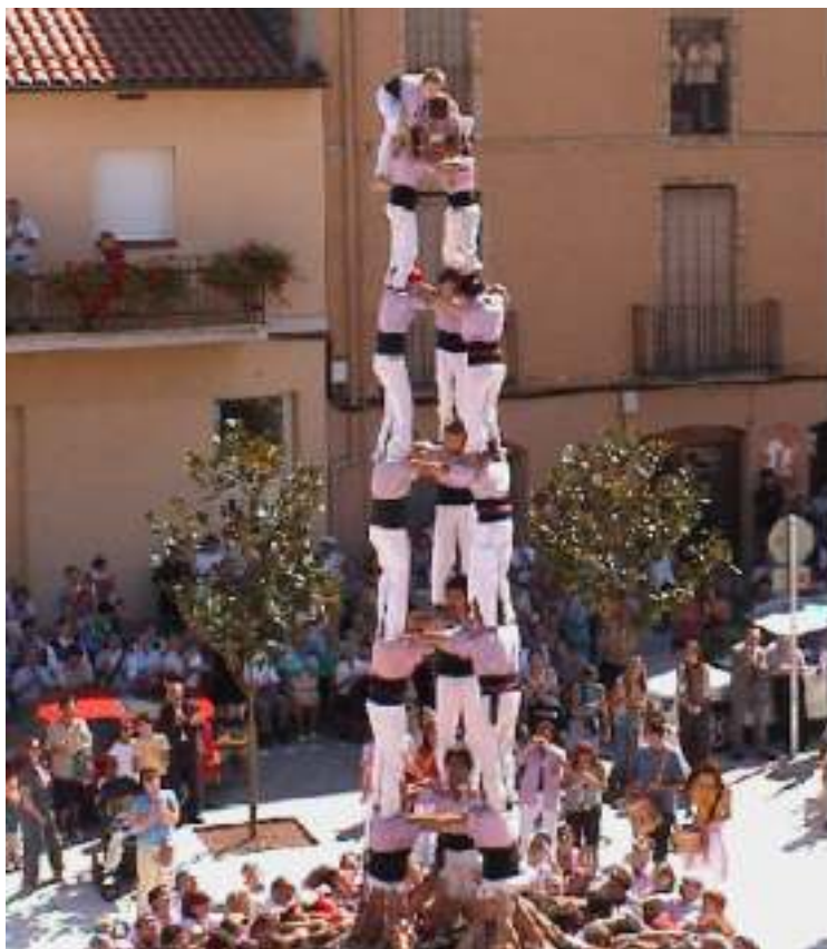
Els Minyons de Terrassa en plena actuació