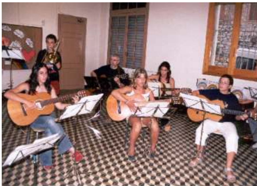
Grup de guitarres