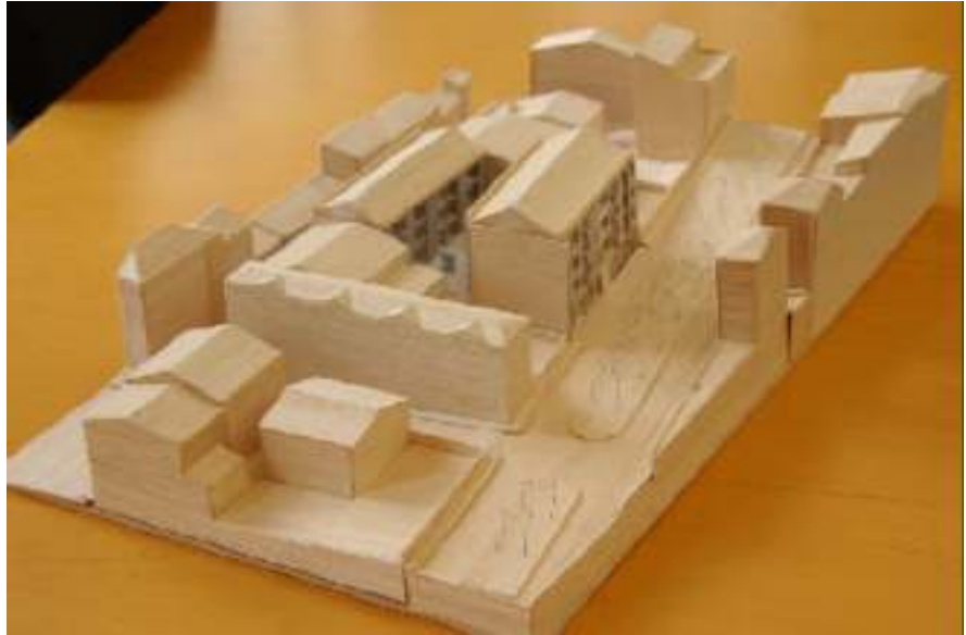
Maqueta dels habitatges de promoció pública al solar de les antigues piscines

En el Ple de l'11 de juliol es va aprovar la desafectació del solar de les piscines velles com a domini públic per passar-ho a bé patrimonial. Aquest és un