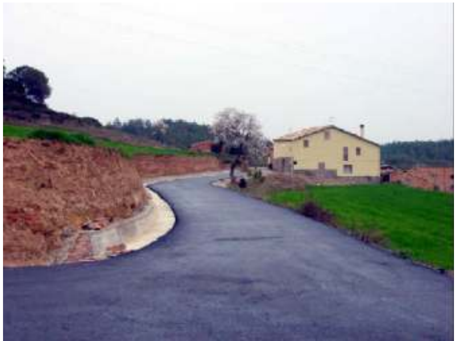
Obres a Horta d'Avinyó

S'ha continuat tirant endavant el projecte de la Plaça. En el passat Garrofi s'informava que s'estava a punt de convocar el concurs. Les obres ja han estat adjudicades i segurament en el moment de rebre aquesta revista ja hauran començat. Es van presentar 3 empreses licitadores: ICMAN, Construccions Ferrer i Vilà Vila. L'obra es va adjudicar a Vilà Vila, de Sant Joan de Vilatorrada, per l'import de 468.630 € (77,9 milions de pessetes) ja que va ser l'única empresa que va presentar baixa respecte de l'import del projecte (encara que aquesta va ser mínima) i es va comprometre a agafar personal del municipi augmentant també el període de garantia i reduint el termini d'execució de l'obra. Seguint amb el tema de la Plaça, el 14 de febrer es va aprovar el modificat del projecte inicial