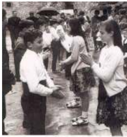
Caramelles del 1969

començaven el dissabte, quan s'anava per les cases de pagès, i s'acabaven el diumenge de Pasqua tot cantant pel poble, com ara.