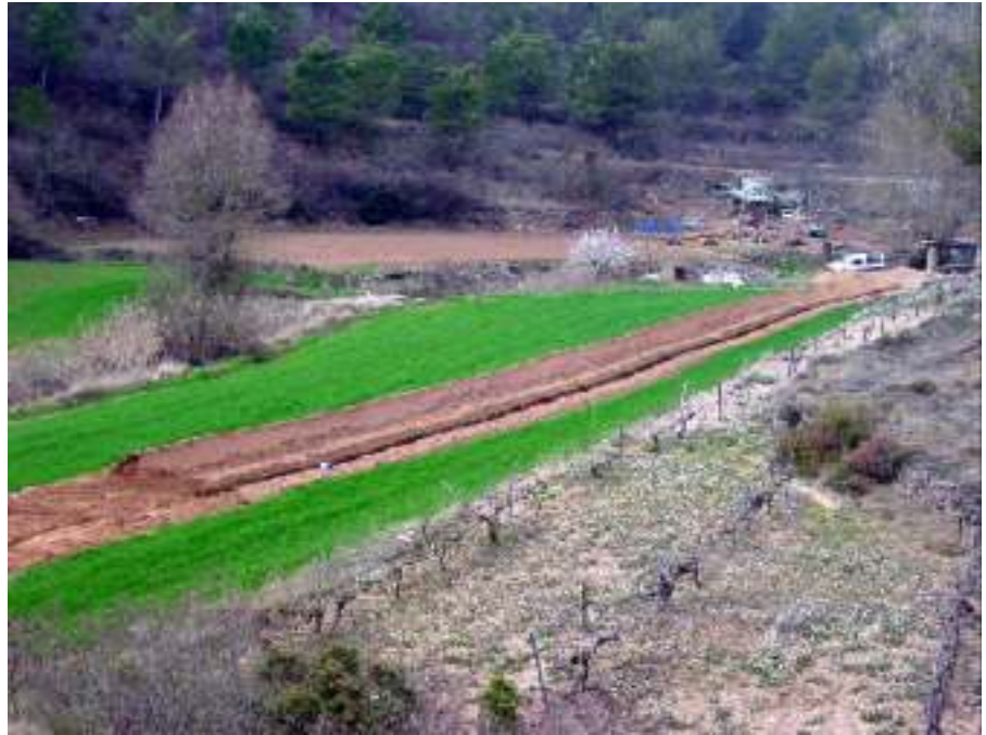
Vista de les obres de la portada d'aigua

Efectivament, un projecte que d'entrada passa de 1,2 milions € (200 milions de pessetes) és important. L'ACA finançarà aquesta operació amb un import del 80%, equivalents a 160 milions. El problema ens ve donat per finançar els altres 40. Estem intentant implicar a altres administracions afectades per aquest tema, i que en poden ser beneficiàries, ja que per si mateix l'Ajuntament no pot absorbir aquesta quantitat. Pensem que tant el Departament d'Agricultura com