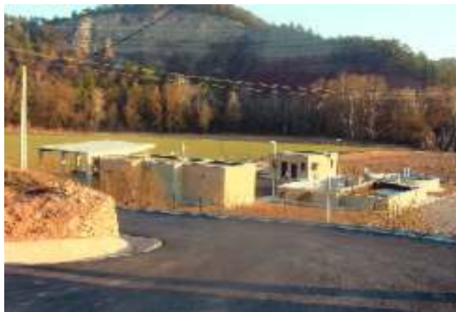
Estació depuradora d'aigües residuals d'Avinyó

Ens diuen, textualment: «Estant assabentats que anys anteriors hi havia una subvenció per asfaltar el