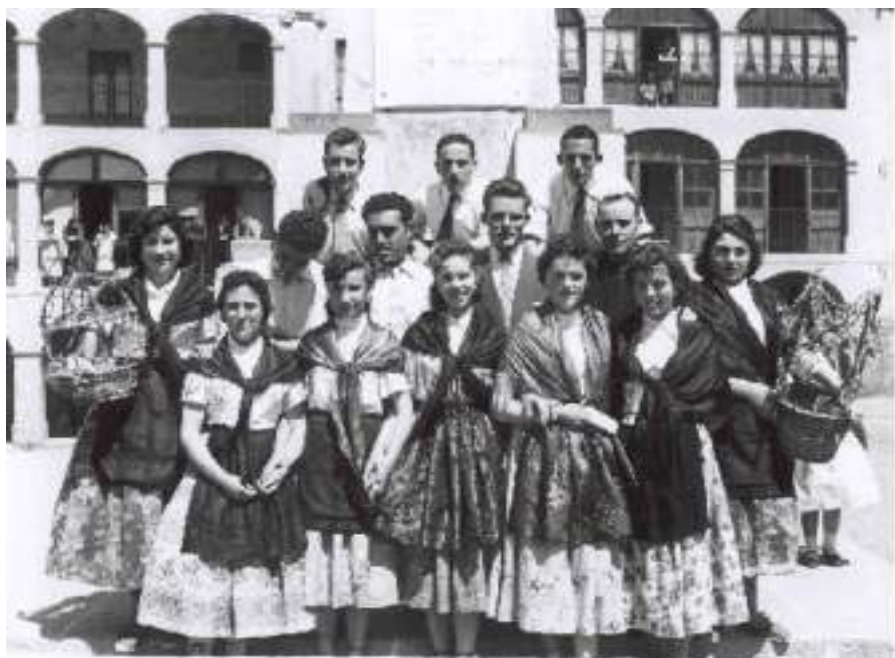
Els caramellaires davant el monument, a la plaça Major, els anys 50