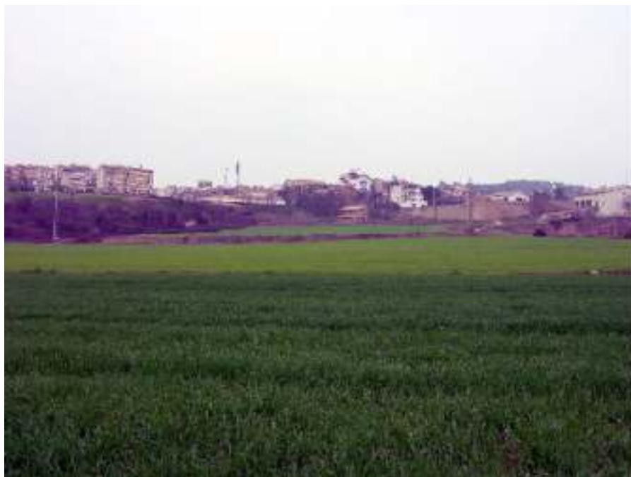
Terrenys de La Coma comprats per l'INCASOL