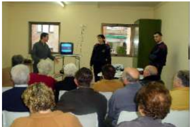
Xerrada que es va fer al Centre Cívic per prevenir contra els euros falsificats