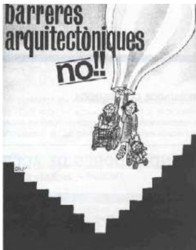
Cartell editat el 1983

representa cap problema, encara menys problemàtic serà si aquesta entrada es troba completament arran de carrer i aquesta solució permet entrar al recinte amb més comoditat per part de tothom. O si parlem de la via pública, és més