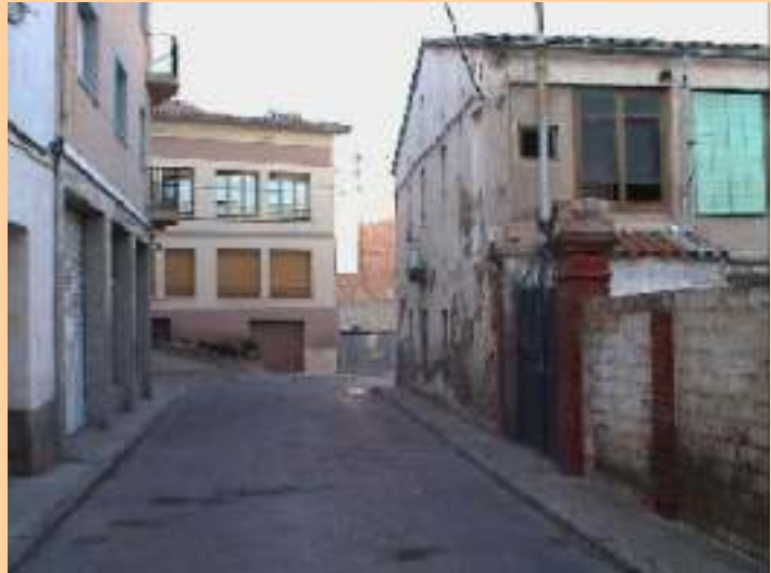
De Turic de Baix a carrer del Mig (1965-2002)