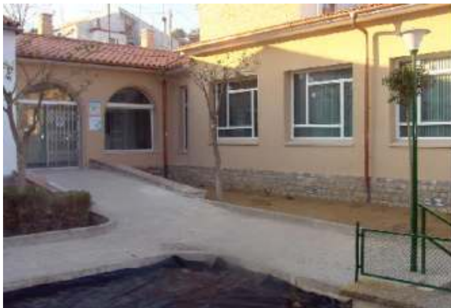
Edifici del nou consultori mèdic d'Avinyó

El nou consultori disposa d'unes instal·lacions modernes, àmplies i confortables que dotaran al municipi d'un nivell d'assistència de màxima qualitat. Cal recordar que la previsió inicial de cost era de 42,7 milions de pessetes més uns 15 milions d'equipament, i que la subvenció demanada en aquell moment era de 34,2 milions. Per tant, l'aportació que havia de fer l'Ajuntament en aquell moment era de 23,5 milions de pessetes. Al final l'obra ha costat 50,1 milions més els 15 de mobiliari, que sumen 65,1 milions. La subvenció ha estat de 42,7 milions més els 15 de mobiliari, amb la qual cosa l'aportació de l'Ajuntament ha estat d'uns 7,4 milions. Aquí cal dir que els costos de jardineria també estan inclosos dintre