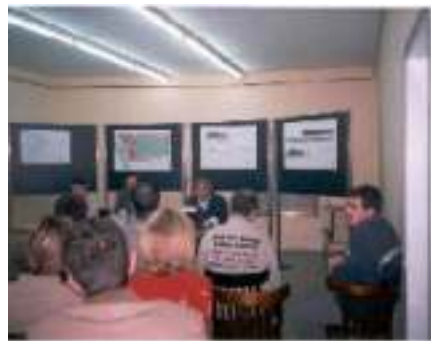
Presentació del projecte del pavelló