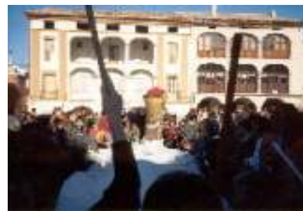
Cagatió a la plaça

Els Reis van clausurar les festes de Nadal, potser la celebració més esperada per als nens i per tothom en general. Gràcies a la col·laboració desinteressada d'un grup de persones que treballa molt de temps per poder portar a terme aquesta festa tan senyalada fent les