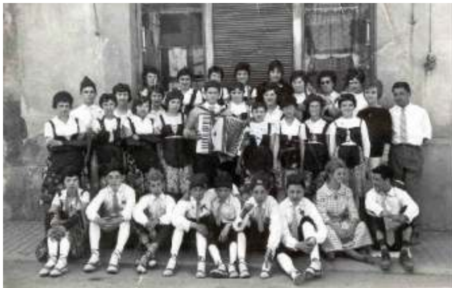
Grup de caramellaires davant de Cal Sastre, els anys 60