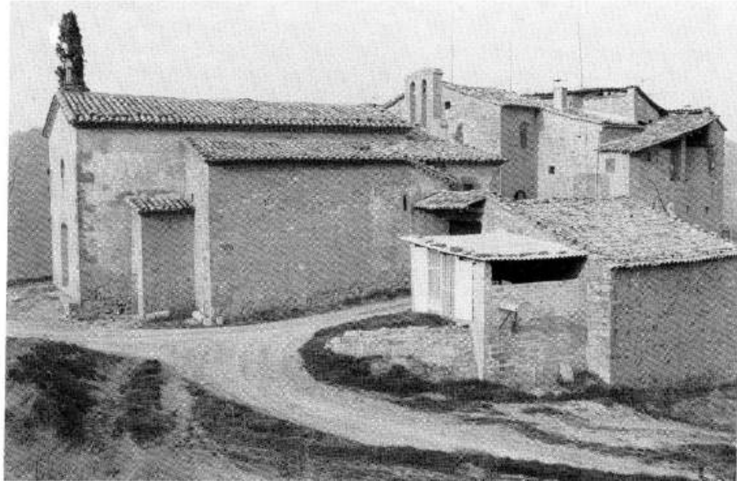
La marxa continua cap a Fussimanya, per terres que eren a la cruïlla de la vall d'Artès, el castell de Sallent i el d'Avinyó.

de la villa Torcona ? Clar que així formulada la pregunta ja suposem que l'origen del Torcó -una casa no gaire lluny de l'església, en direcció contrària a la que segueix la marxa- és una villae romana , i això potser és molt suposar.