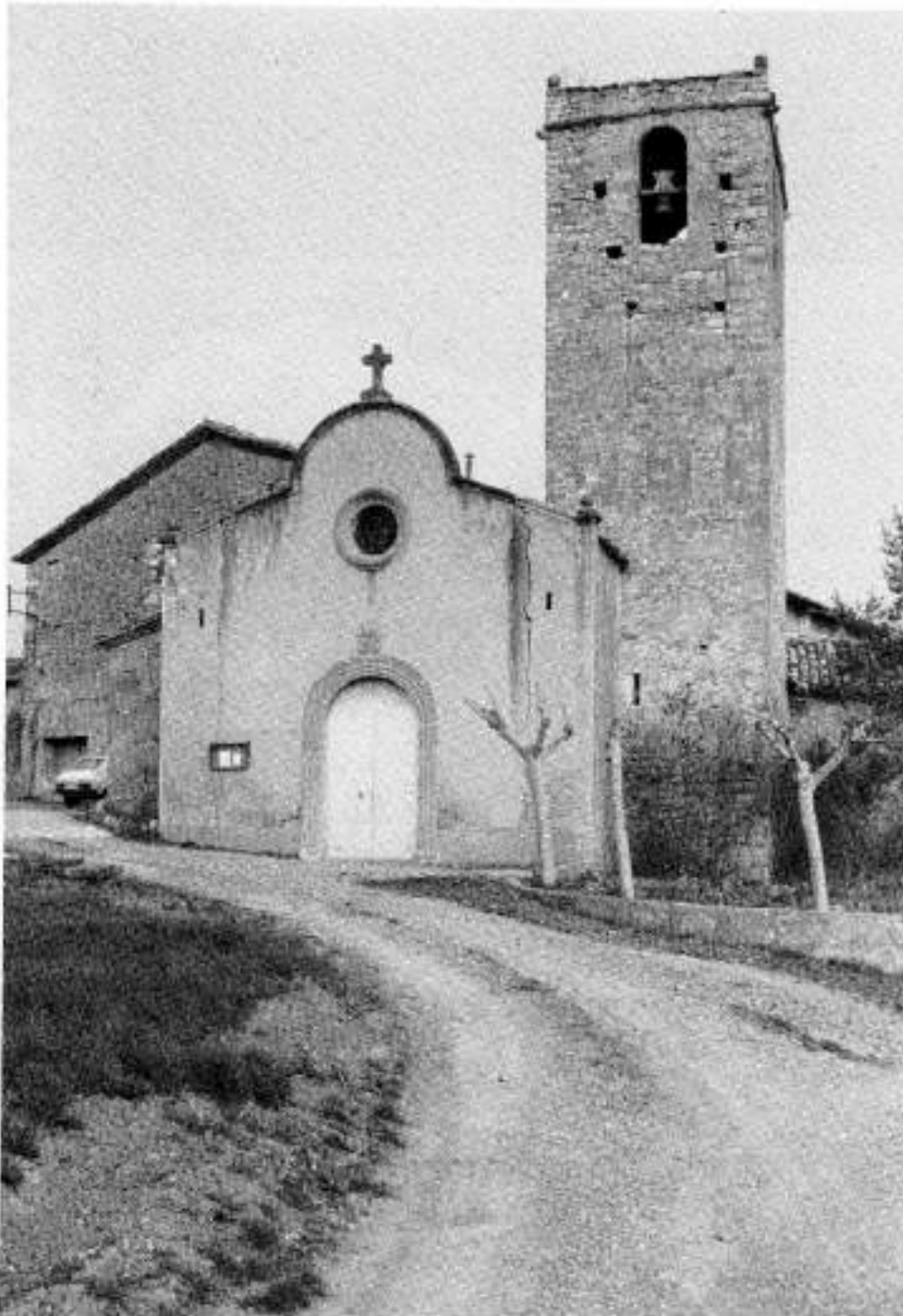
A l'església d'Horta hi ha la sortida.

La història és coneguda: diuen que per una dona els musulmans l'empregueren cap a la península i acabaren amb la dominació visigòtica. De pur intranscendent els hortolans ni se n'assabentaren; al capdavant eren tan estranys els uns com els altres. Còrdova quedava lluny, tant que alguns dels seus representants gestionaren amb Carlemany un canvi de bàndol. El projecte va