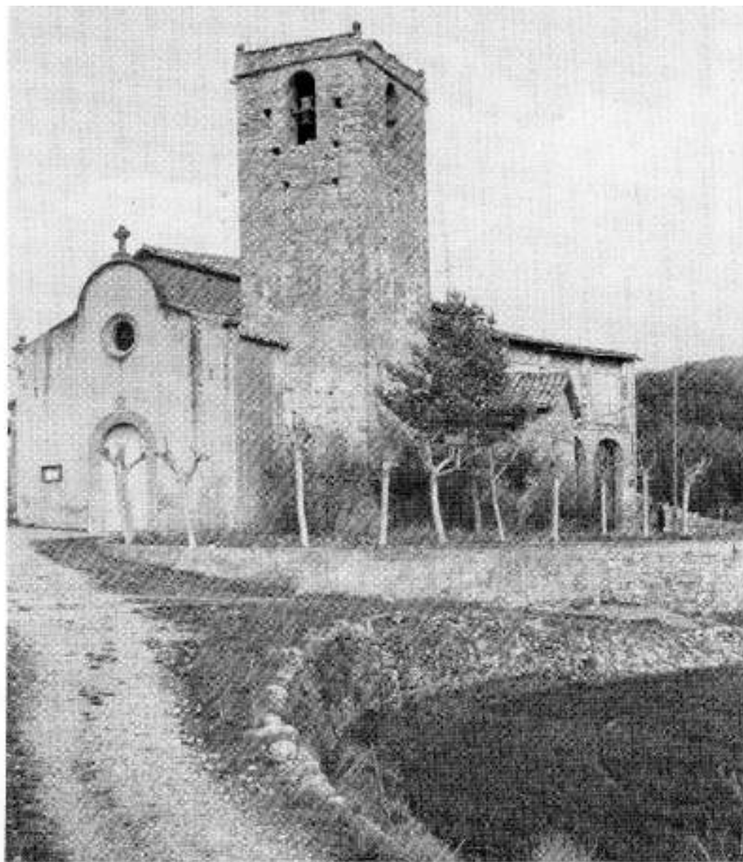
La parròquia de Sta. Maria d'Horta s'integrà de bon principi al terme del castell d'Artés.

Del cert només podem afegir que al darrer terç del segle X el castrum Avingone o d'Avinione atermenava el que avui és Avinyó. Però no tot Avinyó. En efecte, el territori de la parròquia de Santa Maria d'Horta, que avui forma part del terme municipal avinyonenc, s'integrà de bon principi en l'anomenada vall d'Artés; o dit d'altra manera, en el terme del castell d'Artés.