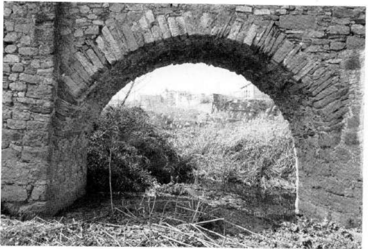
Era com si la humanitat sencera s'hagués abocat a la vall d'Artés.

Llavors arribà gent. O més gent. En un document del 898 hi ha una tal barreja de noms que és com si la humanitat sencera s'hagués abocat a la vall d'Artés. Era com començar de nou i s'havia de posar nom a les coses. Diuen que Avinyó ve de vinya, i és cert que en el passat n'hi havia hagut de vinya, però n'hi havia hagut massa. Benet també ho ha explicat això: un nom per cada cosa i una cosa que identifiqués el lloc, que fos particular del lloc. I de vinya n'hi havia arreu; malament doncs podia identificar el terreny que ara ens ocupa. És d'una lògica impecable. Però si no es pot treure l'entrellat de l'etimologia, deu ser perquè el nom ja vingué fet, el portaren els pobladors. De l'Avinyó francès? d'algun linatge dels altres Avinyó que hi ha a comarques més septentrionals? estaria bé saber-ho.