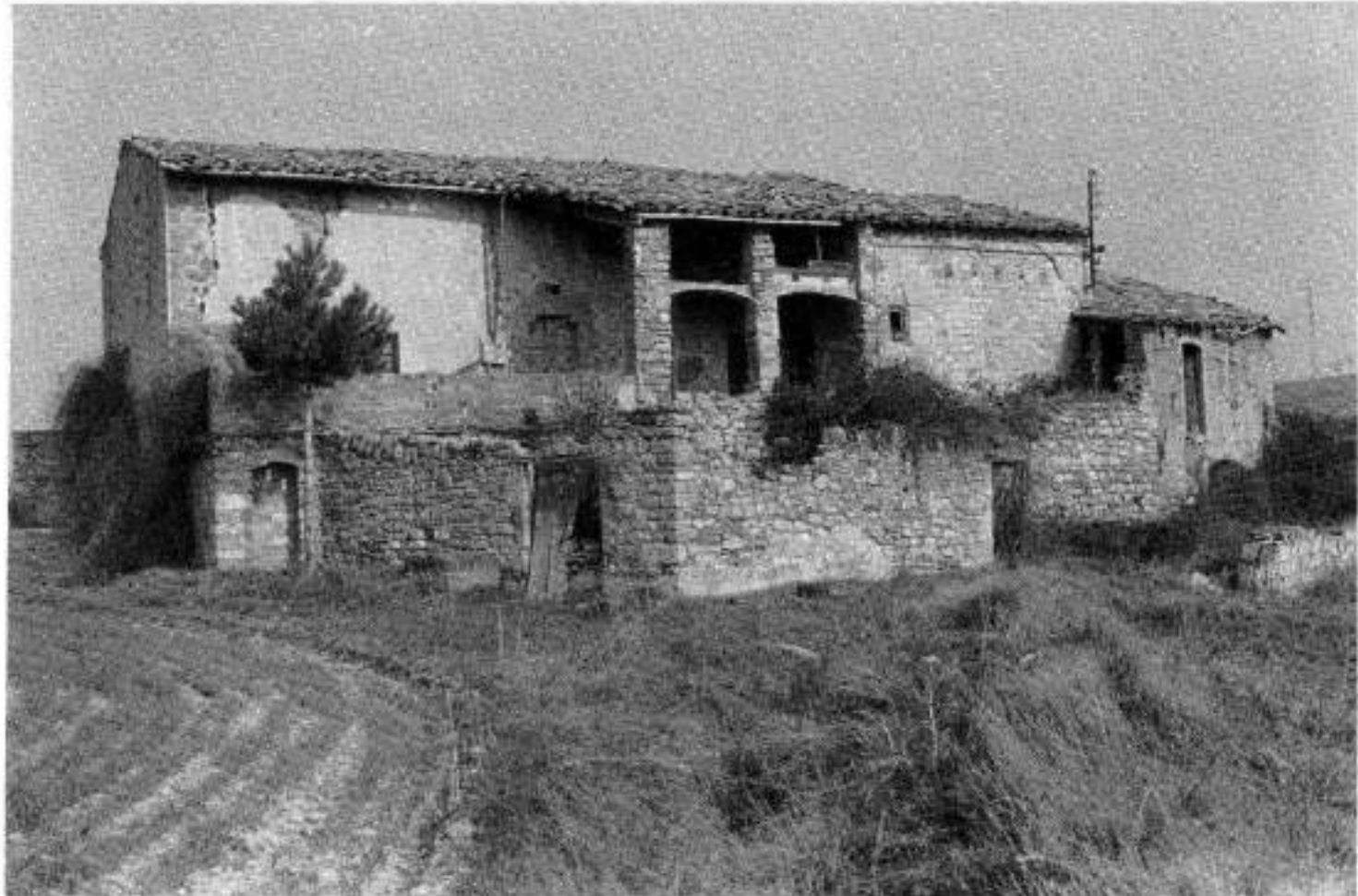
El mas la Caseta, prop de l'església és una mostra de com han anat acabant les masies amb poca terra de conreu.

fracassar i fins i tot s'hi gestà una cançó tan famosa com la de Roland, però això ens allunya del tema. Al Bages, com a Catalunya, encara érem en la primera de les èpoques que hem citat: se n'ha dit les edats obscures. Obscures perquè no en sabem gaire res, però obscures també perquè la gent d'aleshores en sabia ben poc; era un horitzó molt curt, i les fetes de la gran història passaven rera seu, com els guerrers del califa o els de l'emperador. Diuen, que compromesos amb el projecte carolingi, i ja franca -terra de francs- la Septimània, força hispanis s'hi encaminaren i deixaren el sud amb més poca gent que ja no hi havia.